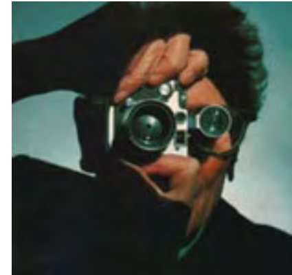
Andreas Feininger, 1996